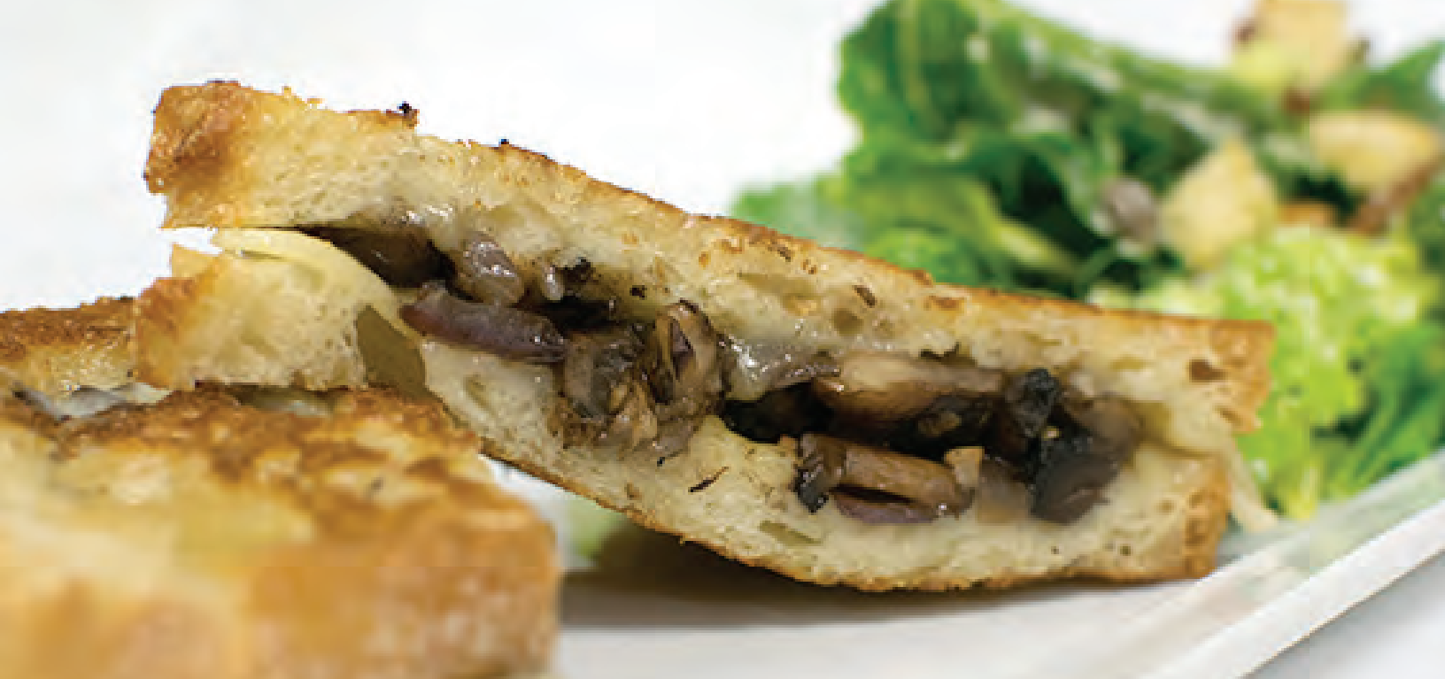
Grilled cheese aux champignons