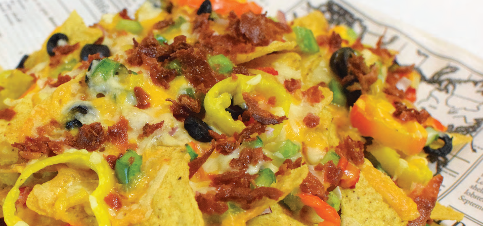
Nachos portion duo avec bacon.