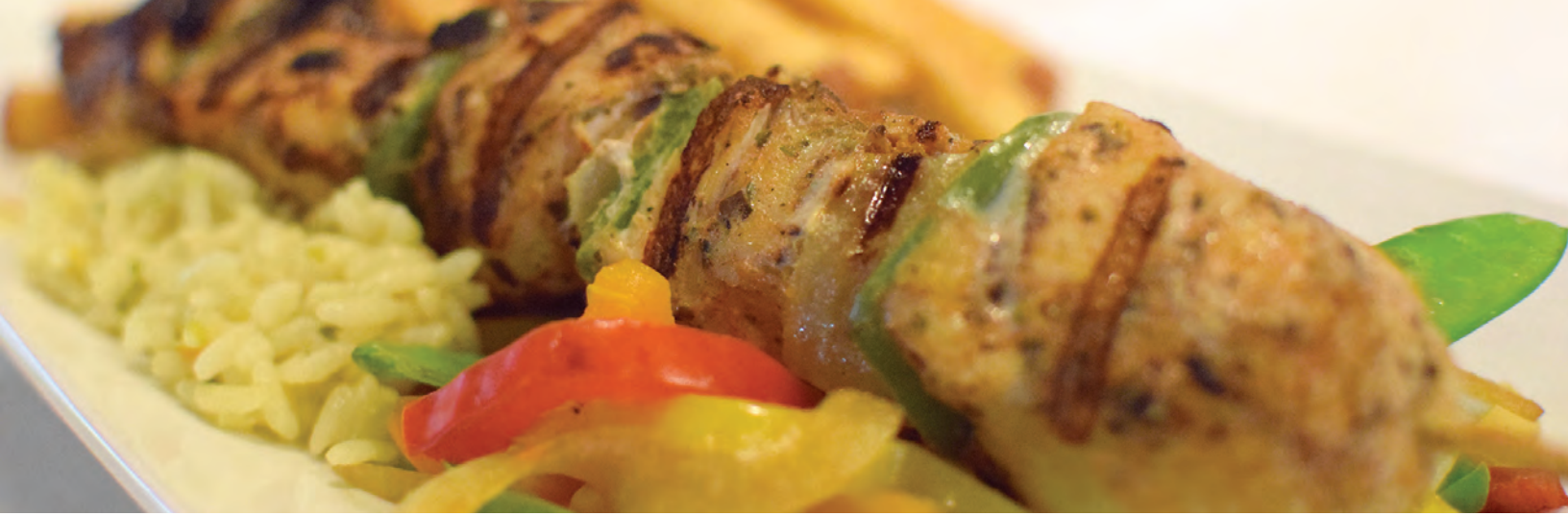
Brochette de poulet